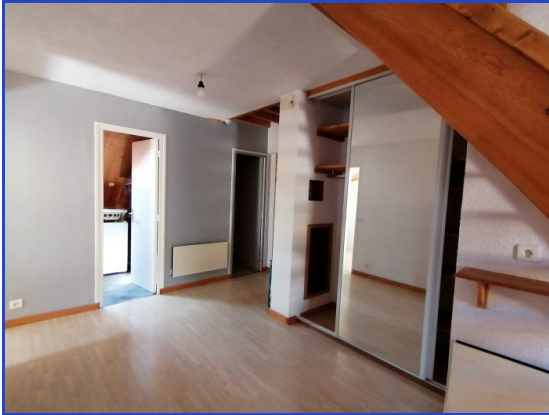
entrée avec dressing