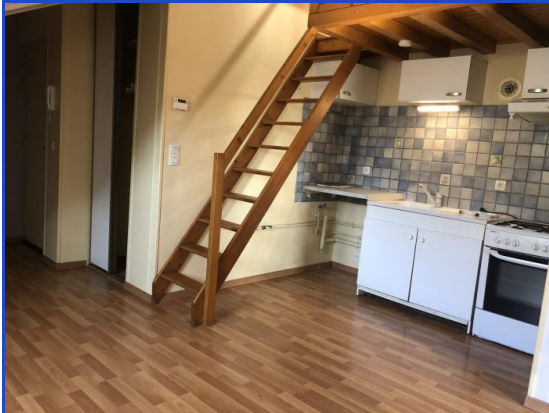
pièce de vie cuisine