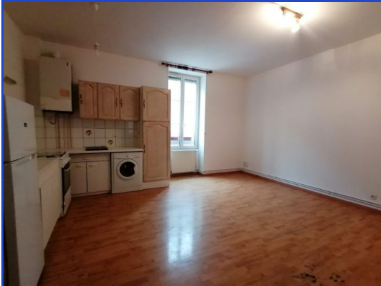
cuisine pièce de vie