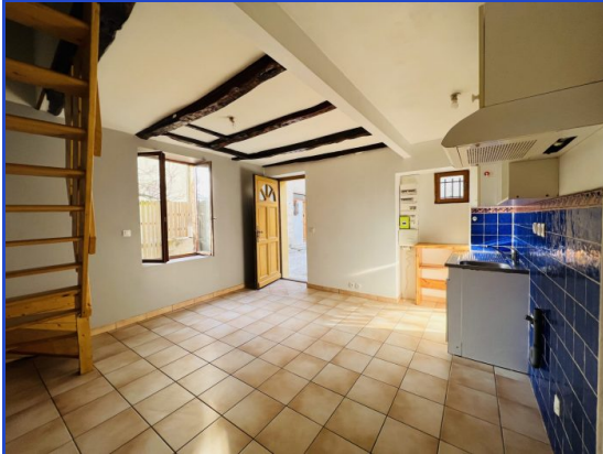
pièce de vie