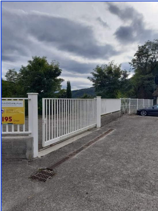
cour parking fermés